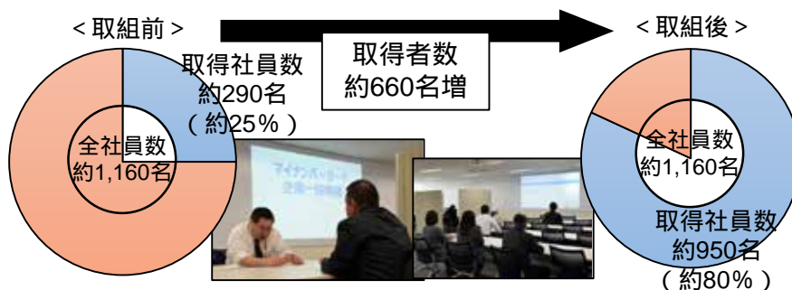
C社のマイナンバーカード取得状況